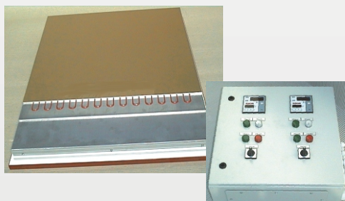
Schnitt durch eine Elektro-Kurztakt-Heizplatte ( Teilansicht) + Elektronische Steuerung mit 2-Kanal-Microprozessor-Digitalreglern.

ELKOM heatingplatens are manufactured individually for your veneerpress . Therefore , we require following details : name of the press-manufacturer , year of manufacturing, type , size and serial number . Terms of delivery : ex works , VAT is not included , packing charges ,transportation and assembly is not included but will be charged separately .