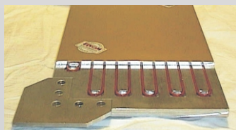
Schnitt durch eine Etagenheizplatte ( Prinzip ) Cross-section of an Intermediate platen (principle)